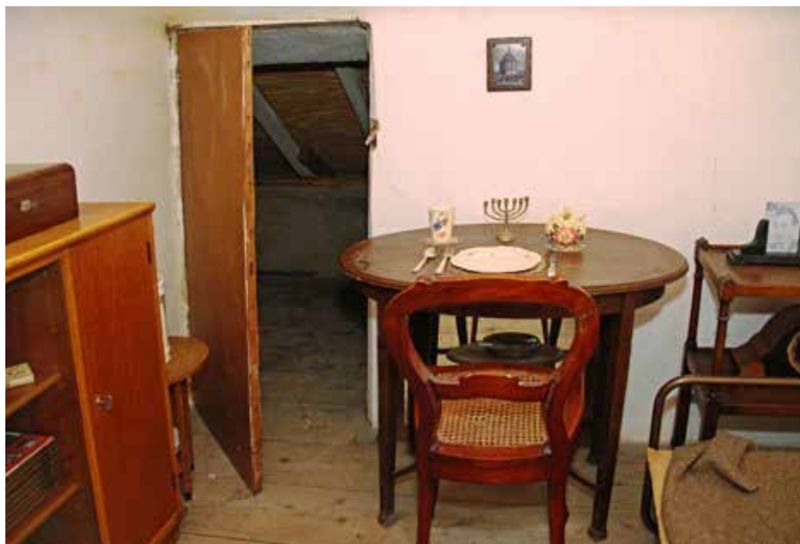
Onderduikkamer op de zolder van Nune Ville